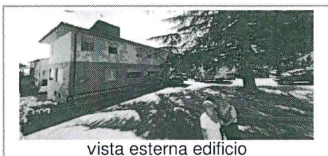
vista esterna edificio

* La SUL indicata ed i relativi volumi sono riferiti alla sola RSA e locali accessori